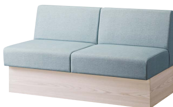
コンフルWN2P W1200 31320-2