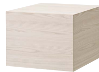
コンフルサイドテーブルWN W450 31320-M ¥59,800