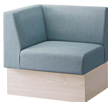
コンフル右アームWN1P W640 31320-4