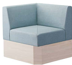
コンフルコーナー WN 31320-8