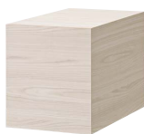
コンフルサイドテーブルWN W300 31320-S ¥49,800