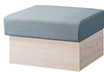
コンフルスツールWN W600 31320-9