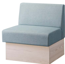
コンフルWN1P W600 31320-1 D/レザー・フロワ