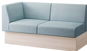
コンフル右アームWN2P W1240 31320-6