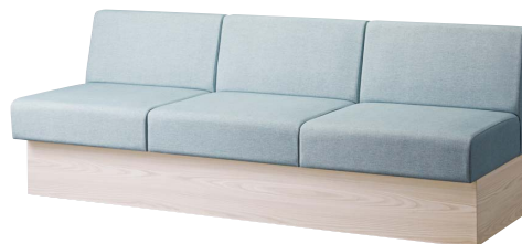
コンフルWN3P W1800 31320-3