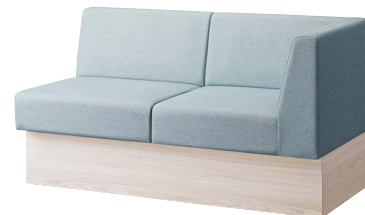
コンフル左アームWN2P W1240 31320-7