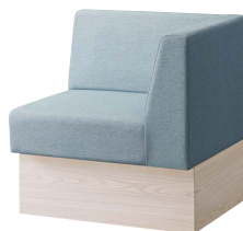
コンフル左アームWN1P W640 31320-5