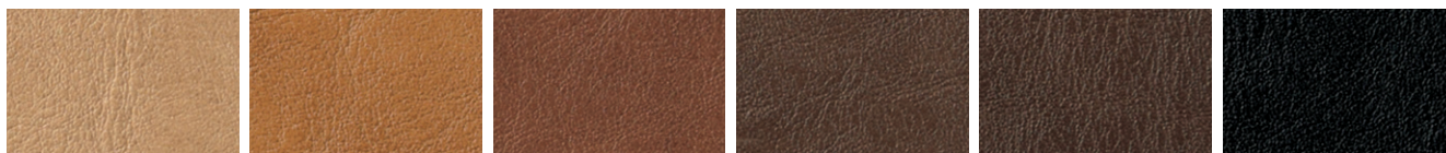
BA-03 BA-01 BA-04 BA-06 BA-07 BA-10

バロン(レザー) 巾:137cm 表:PVC-RoHS2 裏:メリヤス 抗菌・耐アルコール・難燃・耐次亜塩素酸 (Fiore・シンコー大阪)