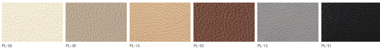
PL-50 PL-30 PL-15 PL-53 PL-13 PL-51

プレザント(レザー) ◎ 巾:137cm 表:PVC-6MF 裏:メリヤス 防汚・耐移染・難燃 (Fiore・シンコー大阪)