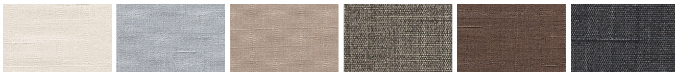
L-8246 L-8250 L-8258 L-8262 L-8276 L-8280

マニエラ(レザー) ※ 巾:122cm 表:PVC-RoHS2 裏:メリヤス 防汚・耐アルコール・耐油・耐薬品・難燃・耐次亜塩素酸 (FURNISHING LEATHER・SINCOL)