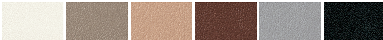
L-8640 L-8650 L-8651 L-8675 L-8665 L-8671

オールマイティー(レザー) 巾:125cm 表:PVC-6MF 裏:メリヤス 防汚・耐アルコール・耐移行・難燃・耐次亜塩素酸 (FURNISHING LEATHER・SINCOL)