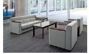
S-SF-172A >>> P545