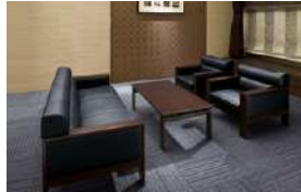
S-SF-1863B >>> P547