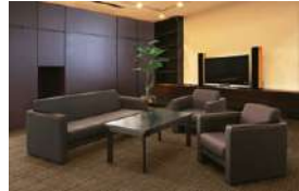
S-SF-490 >>> P548