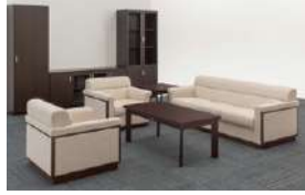
S-SF-170A >>> P543