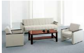
S-SA-54A >>> P550