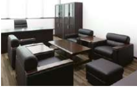
S-SF-514C >>> P542