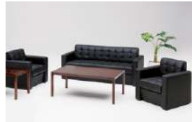
S-SF-55B >>> P550