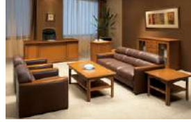
S-SF-967B >>> P544