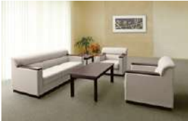
S-SF-171B >>> P546