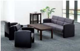
S-SF-481A >>> P549