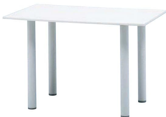
NWT-10×6 W1,000×D600×H650mm フレーム/アルミ 天板/ウェルザリッツ 重量/12.3kg 組立式 ¥60,500(本体価格 ¥55,000)