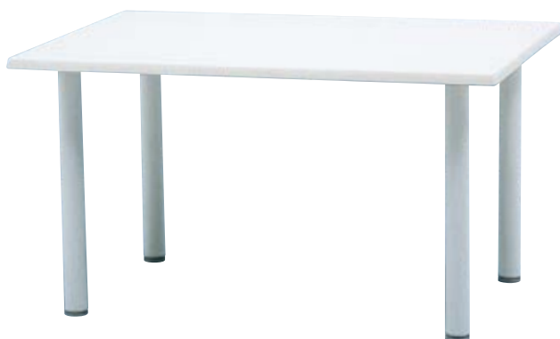
NWT-12×8 W1,200×D800×H650mm フレーム/アルミ 天板/ウェルザリッツ 重量/18.0kg 組立式 ¥73,700(本体価格 ¥67,000)