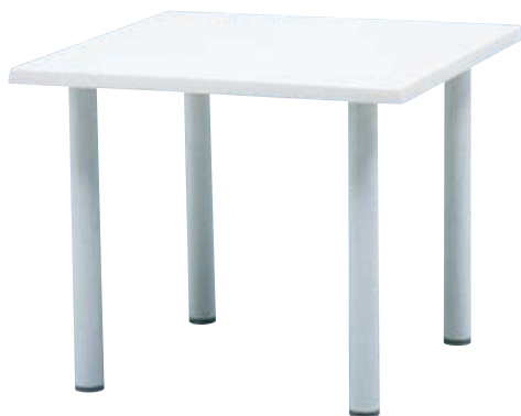
NWT-8×8 W800×D800×H650mm フレーム/アルミ 天板/ウェルザリッツ 重量/13.4kg 組立式 ¥56,100(本体価格 ¥51,000)