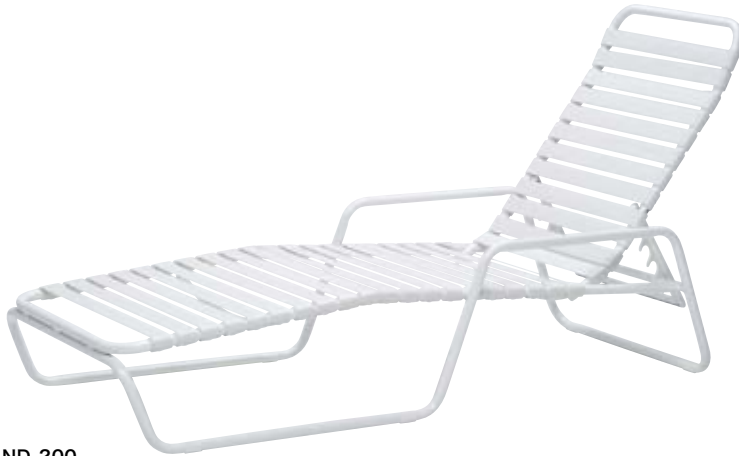
ND-200 W680×D1,970×SH280・H935mm フレーム/アルミ 背・座/塩ビベルト 重量/7.5kg 4段階リクライニング 積み重ね可 ¥81,400(本体価格 ¥74,000)