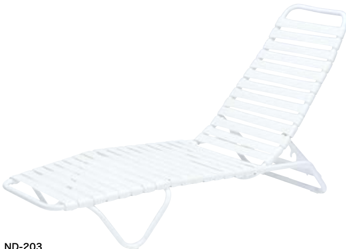
ND-203 W640×D1,840×H210・H915mm フレーム/アルミ 背・座/塩ビベルト 重量/7.6kg 4段階リクライニング 積み重ね可 ¥69,300(本体価格 ¥63,000)