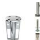
対応パラソル オーシャンマスターMAXキャンチ オーシャンマスターMAXDキャンチ オーシャンマスターMAXクラシック