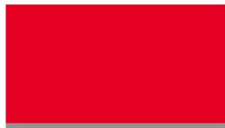
2 サイドパネル(窓無し)