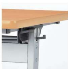
樹脂製フック かばん等をかけること ができます。 (対荷重5kg)