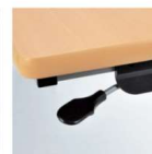
折りたたみ操作レバー レバー操作により天板フ ラップが可能です。