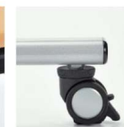
アジャスト機能付キャスター キャスター上部のリング により高さが調節できま す。制動力の高いリフト ロック式ストッパーです。