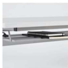
スチールパイプ棚 書類やファイルなどの 収納に便利です。