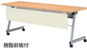
樹脂前板付 天板：メープル・前板：オフホワイト