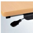
折りたたみ操作レバー 両サイドに付いている どちらか一方のレバー 操作により天板フラップ が可能です。