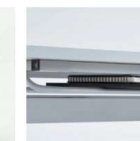
スチールパイプ棚 書類やファイルなどの取 納に便利です。