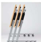
サイドスタッキング スタックピッチ110mm