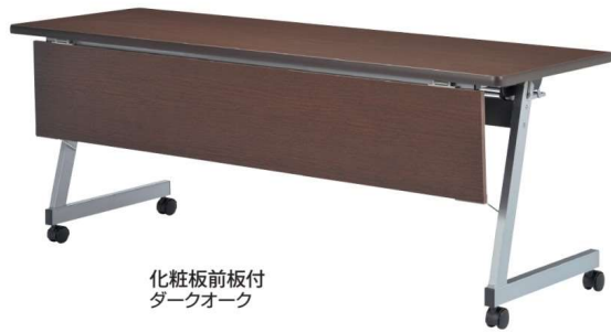
化粧板前板付 ダークオーク