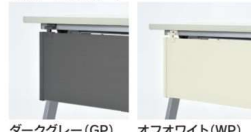
ダークグレイ (GP) オフホワイト (WP)