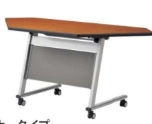
前板付コーナータイプ チーク