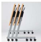
サイドスタッキング スタックピッチ100mm