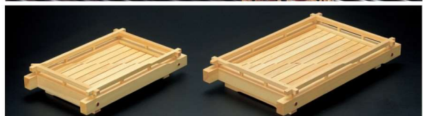
白木 大井川 おおいがわ 盛込器 11-327-11 小 ￥23,900 (W480・D300・H100(内寸)W360・D240・H30)) 白木 大井川 おおいがわ 盛込器 11-327-12 大 ￥27,300 (W645・D375・H100(内寸)W495・D300・H30))