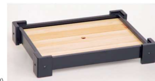
11-327-7 尺5 黒塗り ￥16,500 (W480・D360・H85(内寸)W415・D295・H40)) (再生品)