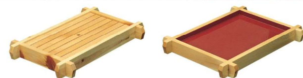
白木 校倉 あざくら 盛込器 11-327-17 ￥20,100 (W610・D460・H60(内寸)W480・D330・H35) 朱(内寸)W480・D330・H25)