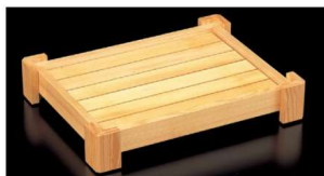
白木 隅足 すみあし 盛込器 11-327-1 9寸 ￥7,800 (W263・D173・H55) 11-327-2 尺0 ￥9,600 (W300・D240・H80) 11-327-3 尺2 ￥12,200 (W360・D270・H85) 11-327-4 尺6 ￥15,200 (W481・D362・H86) 11-327-5 尺8 ￥20,300 (W545・D403・H87) 11-327-6 2尺1寸 ￥26,200 (W635・D457・H132)