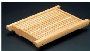
白木 舟型盛込器 11-327-13 小 ￥5,200 (W255・D152・H47(内寸)W188・D128) 11-327-14 中 ￥11,500 (W370・D265・H70(内寸)W300・D205) 白木 舟型盛込器 11-327-15 大 ￥13,850 (W445・D320・H70(内寸)W370・D260) 11-327-16 特大 ￥20,850 (W530・D350・H80(内寸)W407・D271))