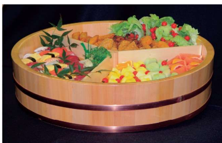
桶型盛込器 11-327-8 桶 ￥54,400 (600φ・H160) 11-327-9 スノコ ￥8,600 (540φ・H30) 11-327-10 仕切 ￥4,950