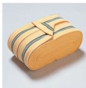
11-275-9 真田紐 ¥ 11,300 (W55・長さ225)