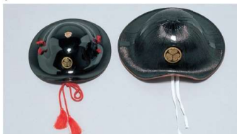
11-275-4 陣笠(子供用) ¥ 7,700 (約270φ・重さ200g) プラスチック 11-275-5 陣笠 ¥ 18,800 (約320φ・重さ530g) プラスチック