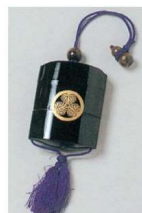
11-275-12 印籠 ¥ 3,500 (W75・D92) プラスチック