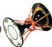
11-275-17 鼓(稽古用) ¥ 39,400 (巾25cm×20φ)