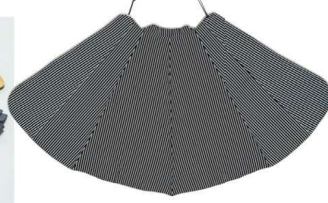
11-275-16 道中合羽 ¥ 11,100 (長さ870) レーヨン100%