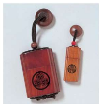
11-275-10 印籠 ¥ 4,200 (W70・H97) 木 11-275-11 印籠 ¥ 1,500 (W30・H73) 木