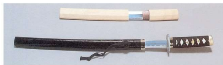
11-275-30 ¥ 13,000 (全長310・刃先180・重さ150g)