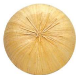
11-275-1 三度笠(すげ草) ¥ 12,600 (φ460)