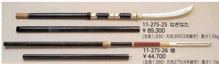
11-275-25 なぎなた ¥ 89,300 (全長1,930・刃先390(3本継ぎ)・重さ1.5kg)