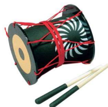
11-275-13 前太鼓(稽古用) ¥ 34,200 (巾18cm×18φ)