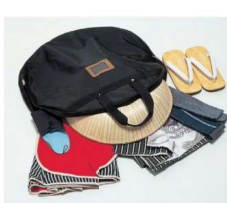
11-275-15 股旅衣裳かばんのみ ¥ 28,000