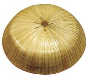
11-275-2 三度笠(小)(パーム) ¥ 3,000 (φ460)