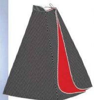
11-275-14 袷せ道中合羽 ¥ 21,000 (長さ1,100) 表: レーヨン100% 裏: アクリル100%