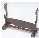
11-275-29 刀掛け ¥ 11,700 (W410・H320)