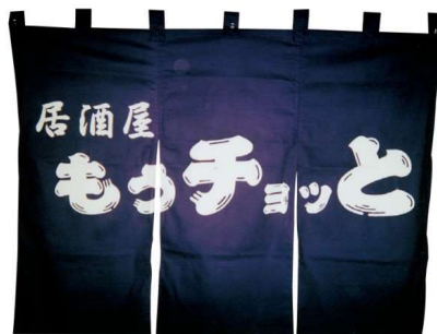
11-271-7 ¥ 68,000 (W1,300・H1,000) 綿100%