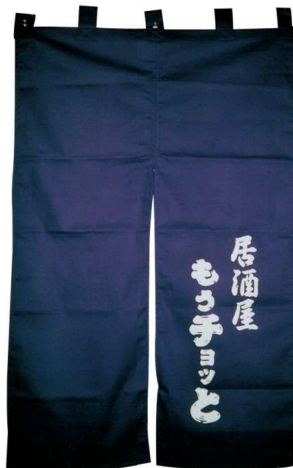
11-271-12 ¥ 49,000 (W750・H1,200) 綿100%