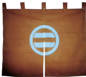
11-271-9 ¥ 59,000 (W850・H650) 綿100%