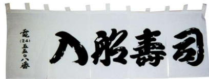
11-271-3 白地 ¥ 54,000 (W1,800・H500) 綿100% 地染 ¥ 73,000 (W1,800・H500) 綿100%