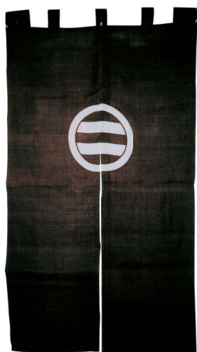
11-271-11 ¥ 140,500 (W850・H1,500) 麻100%