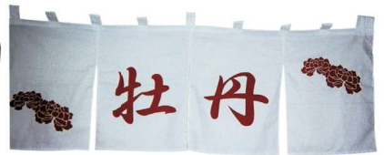
11-271-2 ¥ 83,000 (W1,800・H600) 綿100%