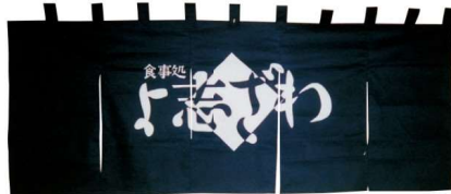
11-271-4 ¥ 97,000 (W1,800・H600) 綿100%