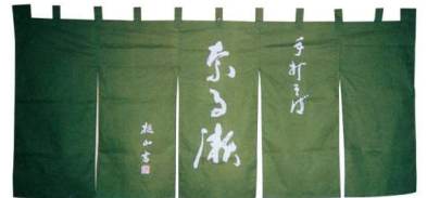
11-271-5 ¥ 97,000 (W1,800・H700) 綿100%