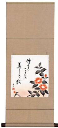
11-161-2K 椿 ¥ 16,000 (W310・H800)