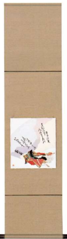
11-161-14K 三十六歌仙 小野小町 ¥ 17,000 (W310・H1,250)