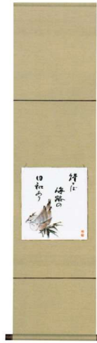
11-161-16K 筍 ¥ 17,000 (W310・H1,250)