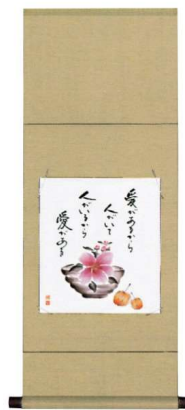
11-161-3K 木権にほおづき ¥ 16,000 (W310・H800)