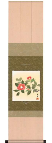
11-161-10K 寒椿 ¥ 17,000 (W310・H1,250)