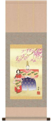
11-161-6 立雛 ¥ 12,000 (W310・H900)