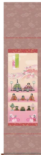
11-161-18 段飾り雛 ¥ 15,000 (W350・H1,400)