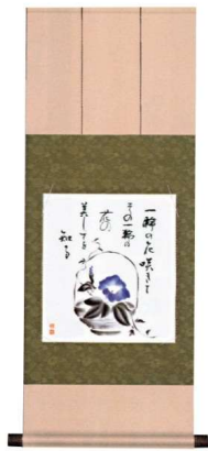
11-161-1K 朝顔 ¥ 16,000 (W310・H800)