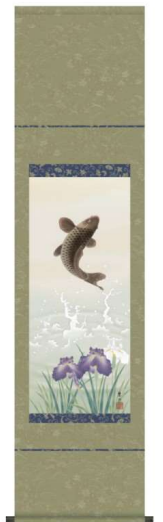
11-161-19 跳鯉 ¥ 15,000 (W350・H1,400)