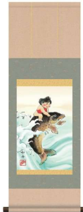
11-161-9 大昇鯉 ¥ 12,000 (W310・H900)