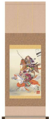
11-161-8 大成武者 ¥ 12,000 (W310・H900)