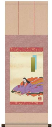
11-161-7 お雛 ¥ 12,000 (W310・H900)