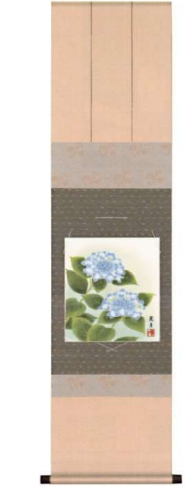
11-161-17K 紫陽花 ¥ 17,000 (W310・H1,250)