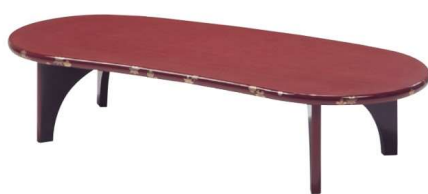
座卓 11-121-11 ¥1,428,000 (W1,700・D772・H350(5.6尺)) 朱ウルミ乾漆塗(面)存清銀華紋