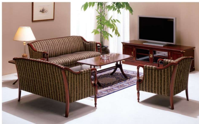
3Pソファー(平織) 11-121-12 ¥624,000 (W1,720・D750・H770(SH390)) 2Pソファー(平織) 11-121-13 ¥507,000 (W1,300・D750・H770(SH390)) アームチェア(平織) 11-121-14 ¥360,300 (W720・D750・H770(SH390)) センターテーブル 11-121-15 ¥292,500 (W1,244・D624・H450) サイドボード 11-121-16 ¥175,500 (W584・D444・H450) TVローボード 11-121-17 ¥906,300 (W1,650・D450・H500)