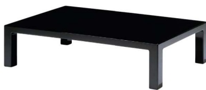
座卓 11-121-9 ¥3,432,000 (W1,504・D874・H350(5.0尺)) 黒呂色漆塗、存清古代紋中心柄