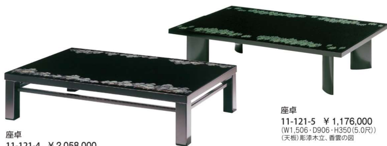
座卓 11-121-4 ¥2,058,000 (W1,510・D910・H350(5.0尺)) 黒漆塗(天板)黒呂色漆塗、彫漆樹林の図