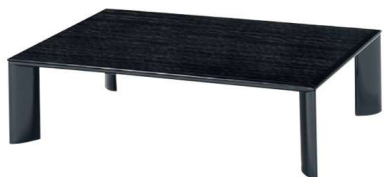
座卓 11-121-6 ¥588,000 (W1,350・D810・H349(4.5尺)) 黒漆塗(天板)黒クシ目塗