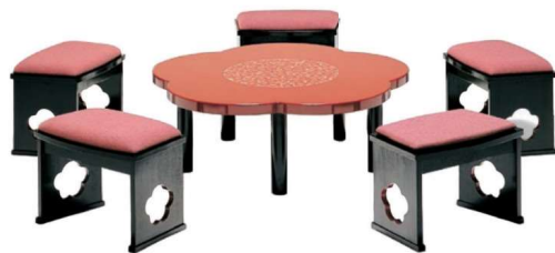
座卓 11-121-2 ¥1,014,000 (W1,030・D1,010・H320(3.4尺)) 朱漆塗、彫漆梅の図 スツール 11-121-3 ¥156,000 (W500・D330・H350) 樽材、黒目ハジキ 張地/平織レッド