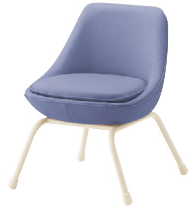
ユッタ WH ¥37,100 張材: レザー・A-80 (No.87)