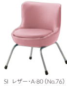
SI レザー・A-80 (No.76)