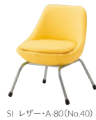
SI レザー・A-80 (No.40)