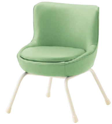
マーギー WH ¥39,900 張材: レザー・A-80 (No.84)