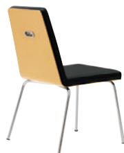
CR-5N レザー-C-22 (No.6)