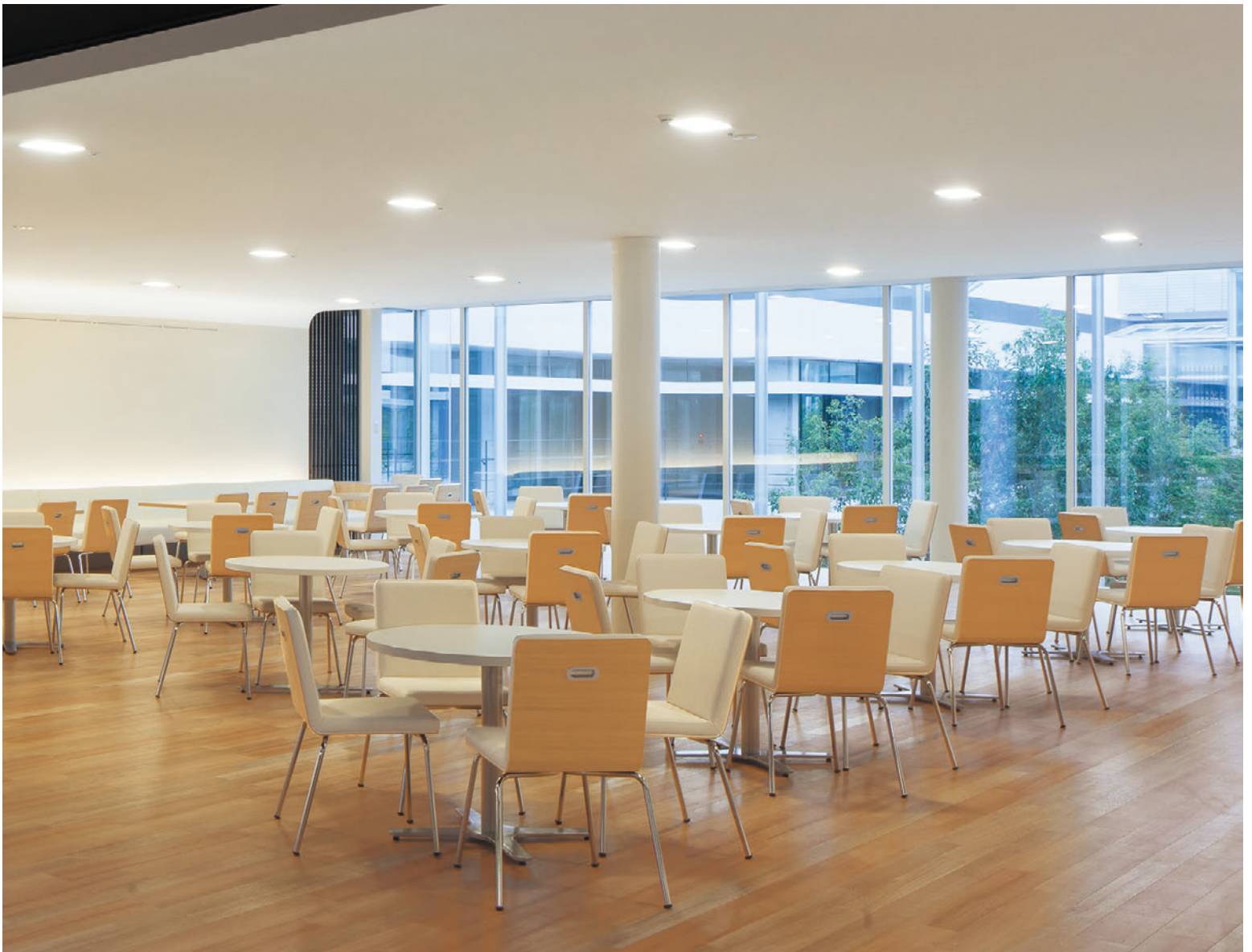
▲テレスL CR-5N 張材:レザー