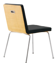
CR-5N レザー-C-22 (No.6)