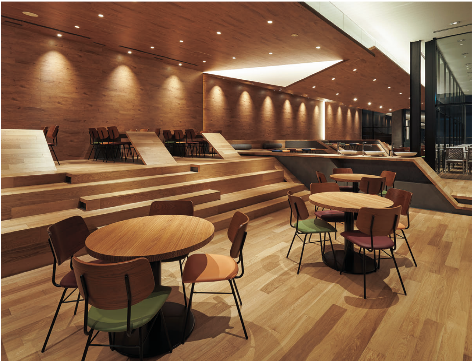
▲ミロス2 BR 張材:レザー