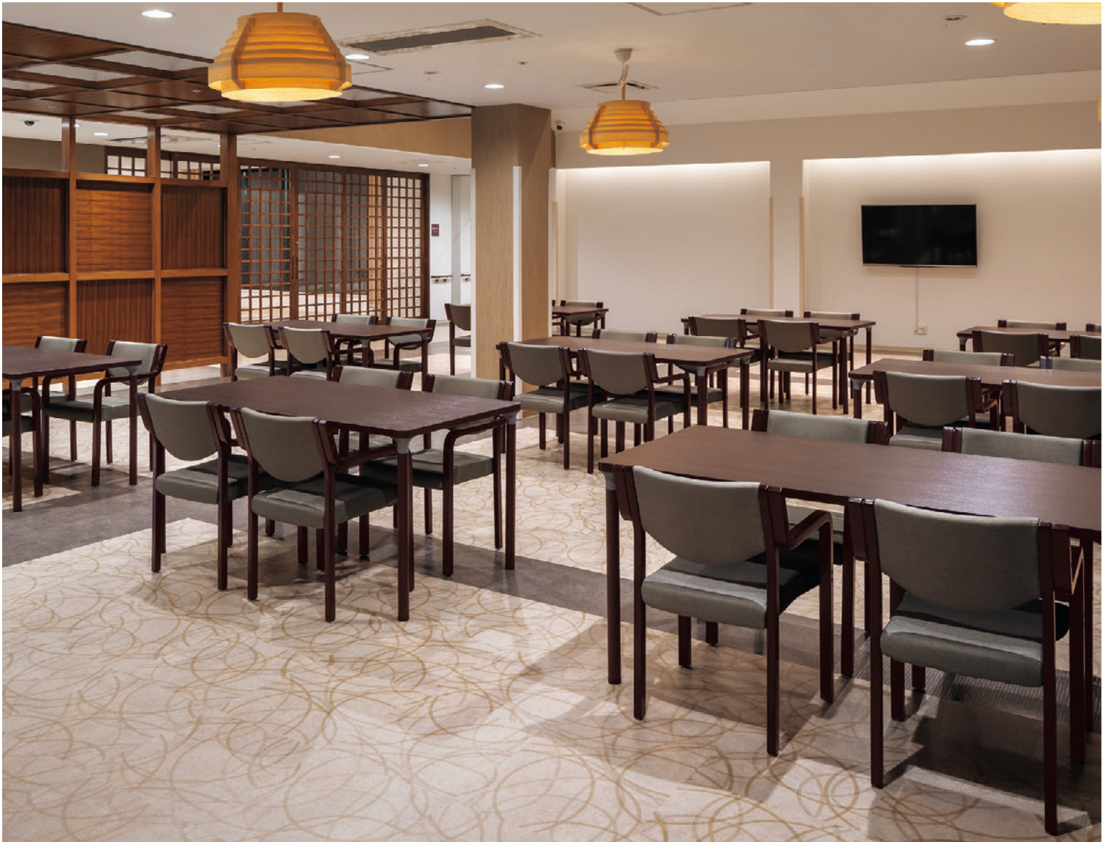
▲リスカB 1N ¥51,700 張材:レザー-C-12 (No.18) テーブル:T18 1N-1500W800D (エッジ特注仕様) - MD-DB (P315)