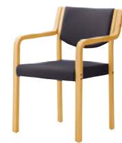
5NL レザー-C-12 (No.19)