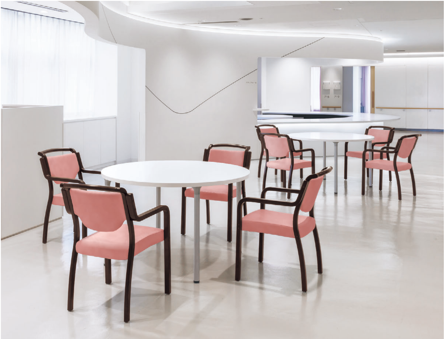
▲ロワ1N ¥57,300 張材:レザー・C-38 (No.3) テーブル: T18 MW-1200φ - MD-SI (P315)