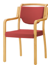
5NL レザー-C-12 (No.13)