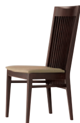
1N レザー-B-26 (No.1)