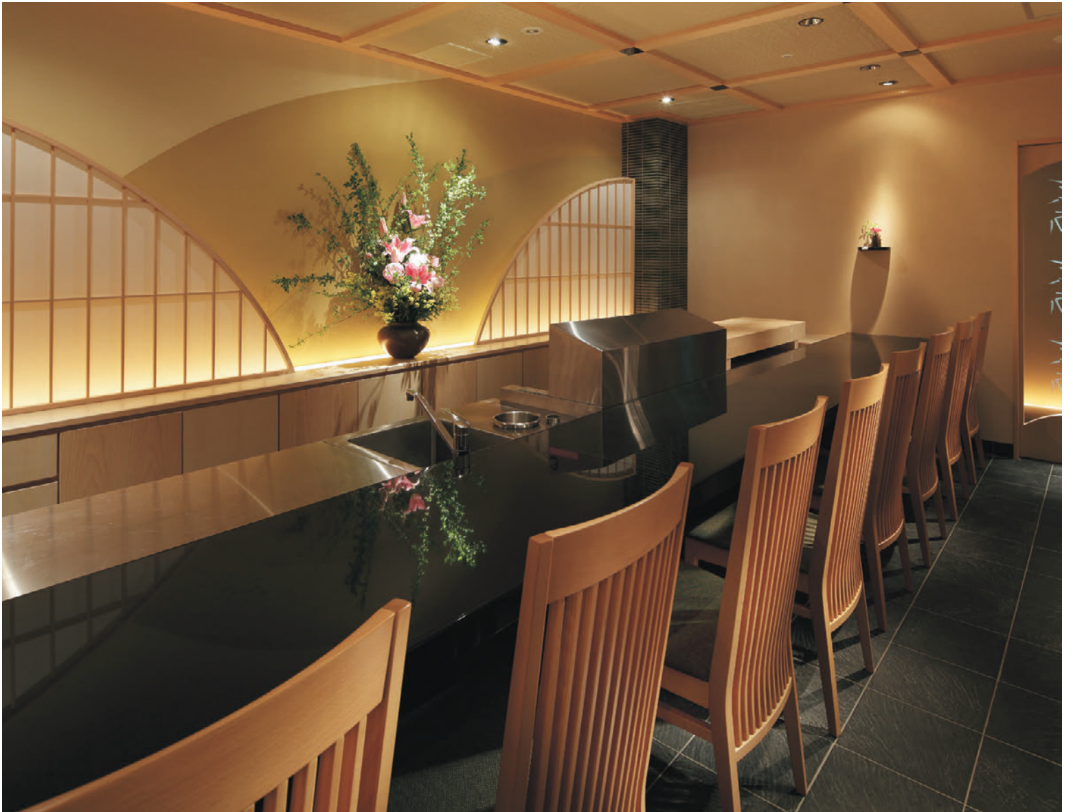
▲サルミ 5N 張材:布地