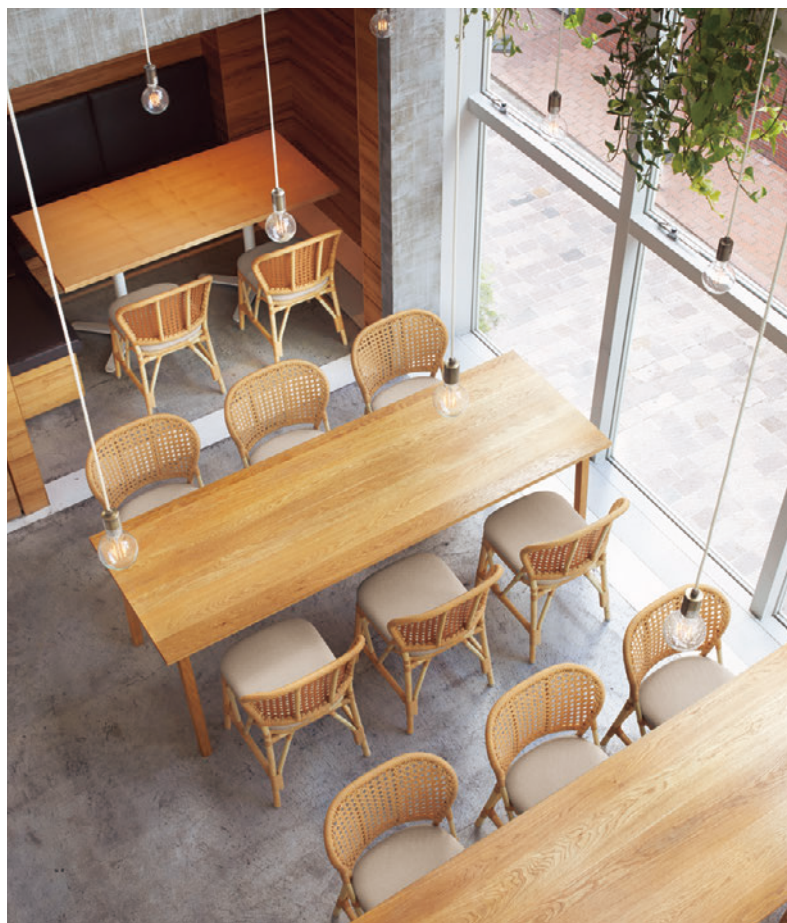
▲グレーテ2 NA ¥42,400 張材：レザー・C-12 (No.20)