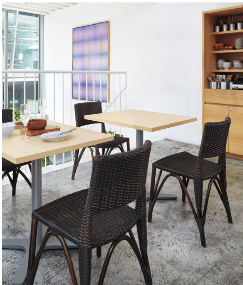
▲クラルス1 DB ¥38,300 テーブル：T18 MN-600W 750D - GV-SI (P315)