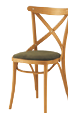
2 HO 布地:C-52(オリーブ)