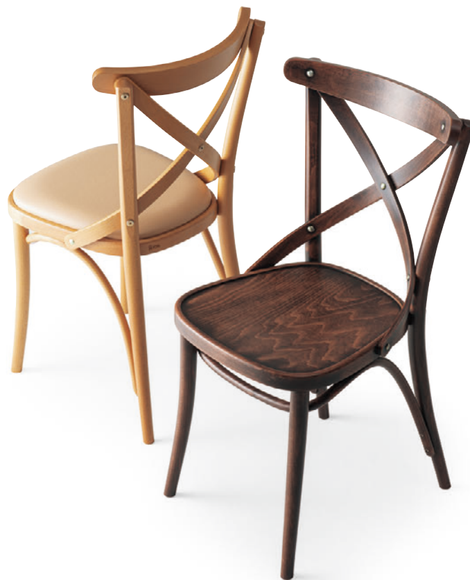
▲ベケット1AC ¥63,900 ベケット2HO ¥62,900 張材:レザー・B-15 (No.39)