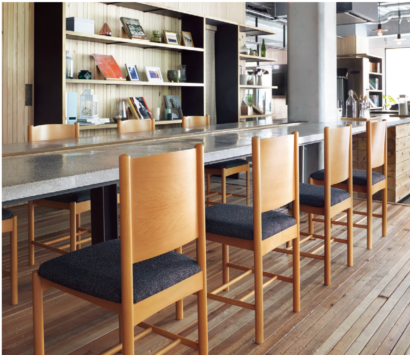
▲エトーレ 5N ¥44,000 張材:布地・C-42 (ダークグレー)