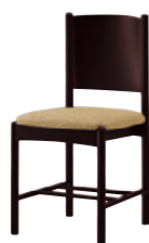
1N レザー・C-38 (No.10)