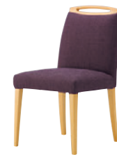
5N-BC 布地・D-54 (ハイオレット)