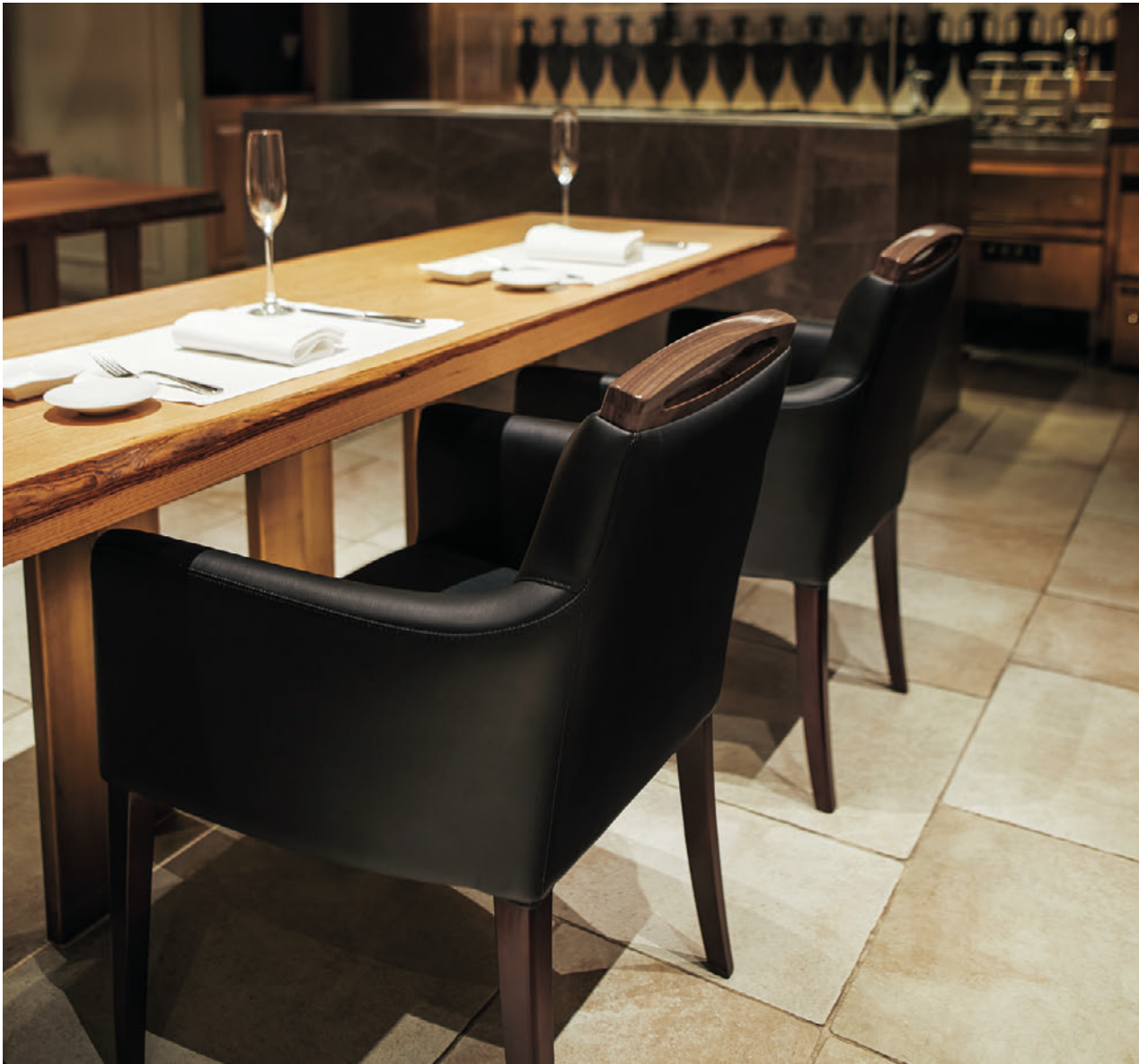
▲アモードW 1N-WN ¥83,700 張材:レザー-C-22 (No.6)