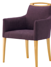
5N-OA 布地・D-54 (ハイオレット)