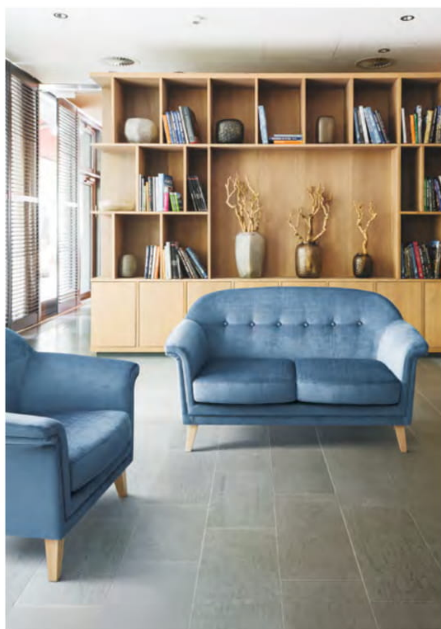
スージー >> P.269 / スピリットAC

ファブリック詳細 | スピリットAC >> P.474 ノルディウォームIIAC >> P.474