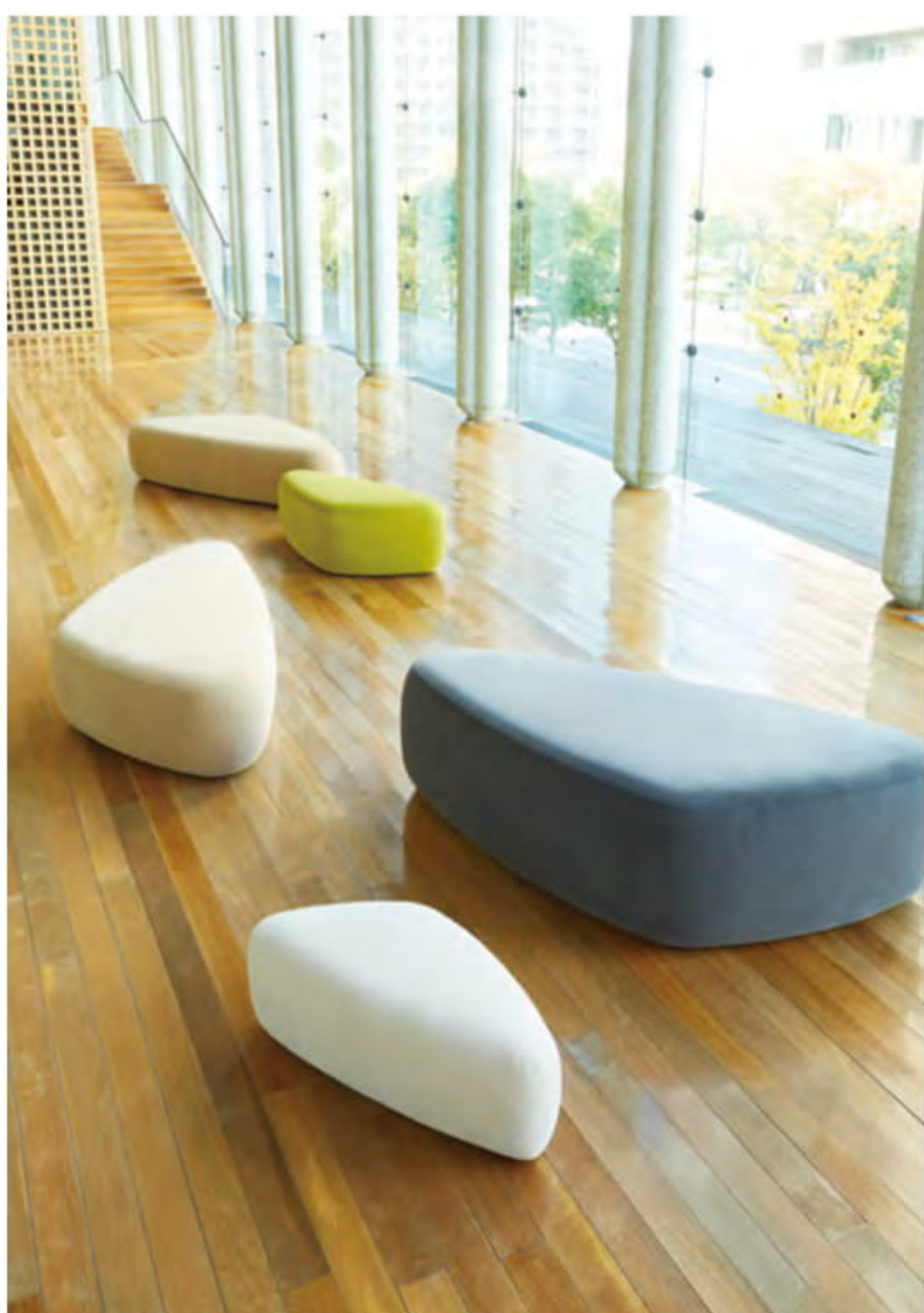
ロト >> P.334 / ノルディウォームIIAC