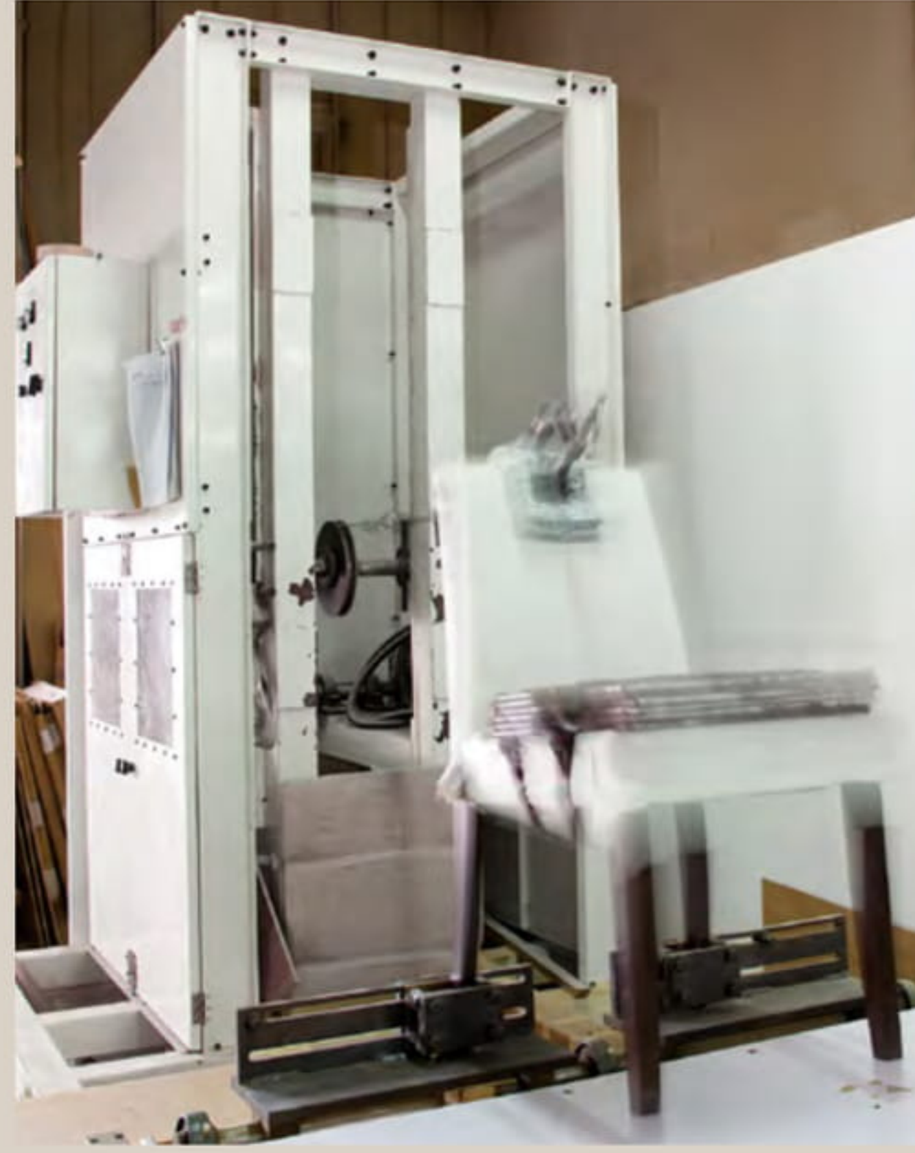
繰り返し衝撃試験を実施中のカトレア。

様々な人が様々な状況で使う業務用家具。それゆえに製品の強度試験もまた、想定外のレベルまで行います。通常、木製イスでは4千回実施して問題なければ日本国内の基準（JIS規格）に準拠していると言えますが、アダルではその5倍となる2万回のテストを実施（一部除く）。圧倒的な強度と耐久性を支えるのは、アダル独自の技術。接合部に小さな溝を走らせることで接着剤を行き届かせる「斜線ホゾ」は、その一例です。細部にわたる配慮がアダルの家具の品質を実現しています。