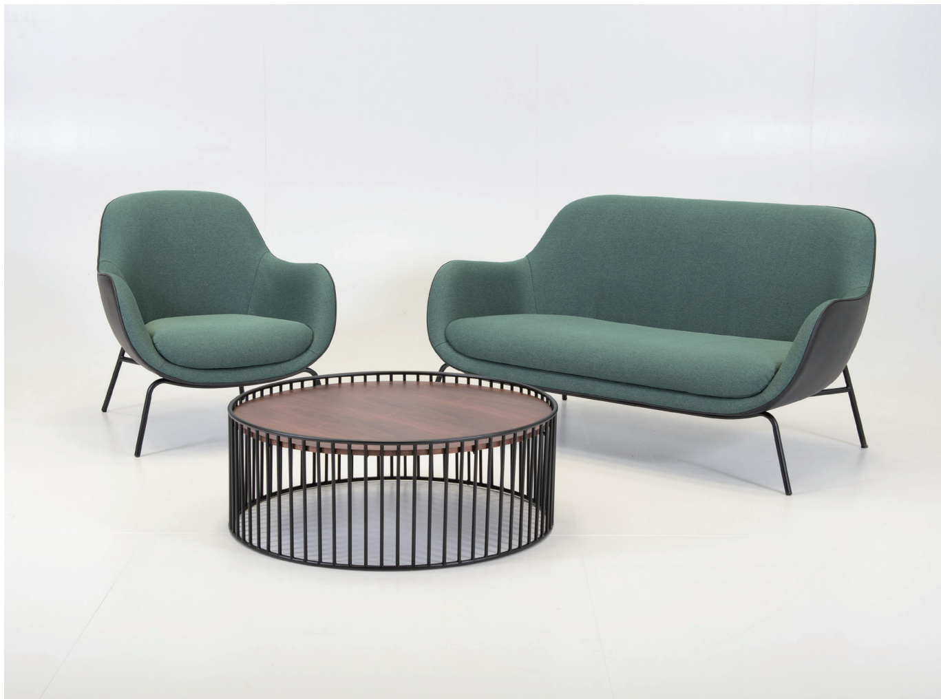
左:MYC1405GR 右:MYS0495GR テーブル:MYT0737BD、(P.159)